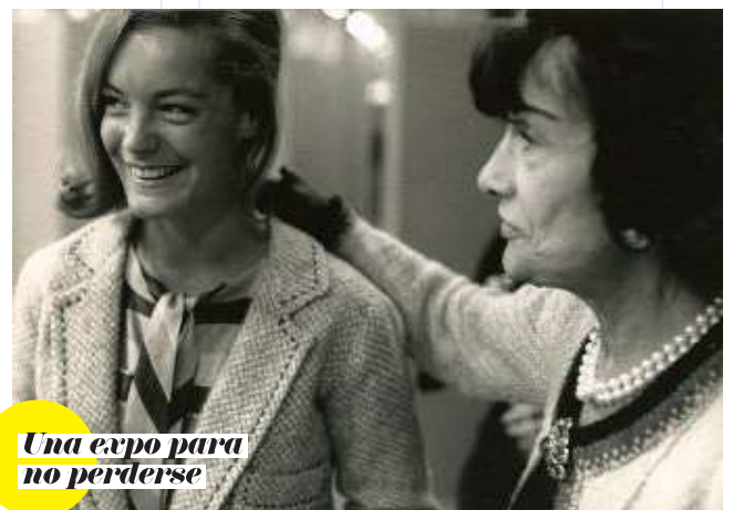
Romy Schneider y Gabrielle Chanel en 1965.